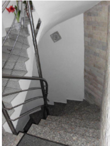
Treppenhaus zum Kellergeschoß